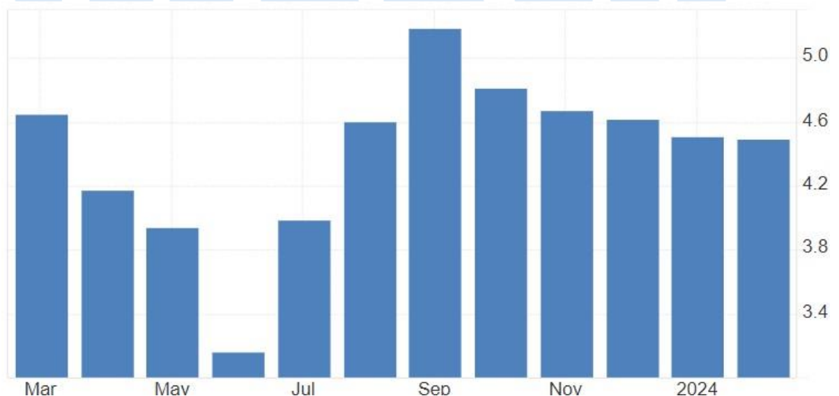
IPCA anual – Brasil: